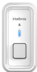
CIB 101 ME Branco Módulo Externo