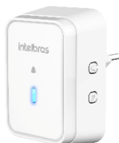
CMI 101 Branco Módulo Interno