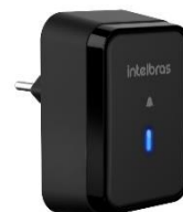
CMI 101 Preto Módulo Interno