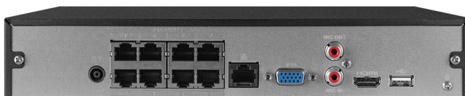
Vista traseira NVD 3308-P